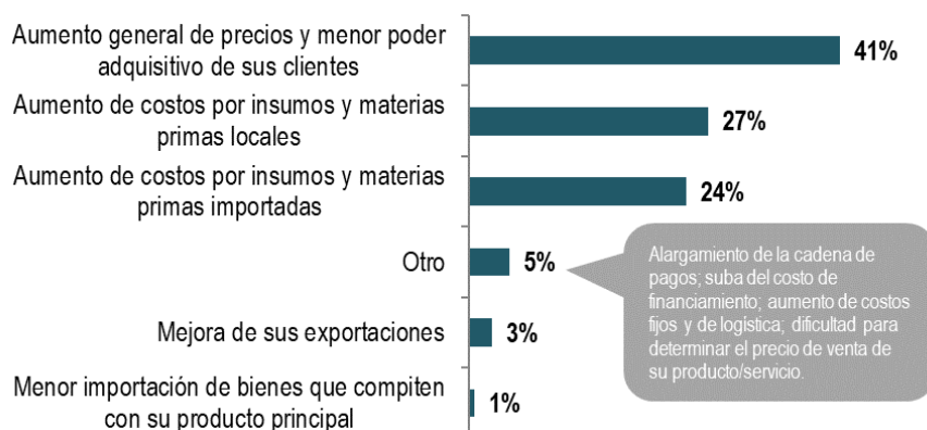
Gráfico 1 – Principal efecto de la devaluación (% de PyME manufactureras)