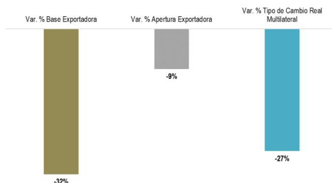
Gráfico 2 - Efecto del tipo de cambio real sobre la cantidad de PyME exportadoras y las ventas al exterior (variación % 2019* vs. 2007)