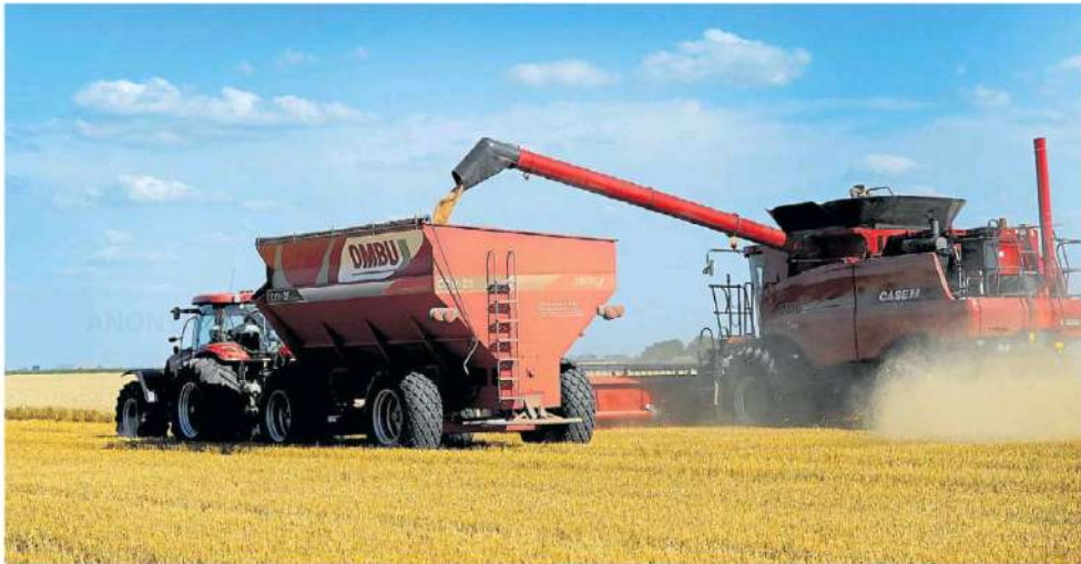
Maquinaria agrícola. Es uno de los sectores que mejor pasó la pandemia dado que el campo no paralizó su actividad. Aún así impera la cautela.